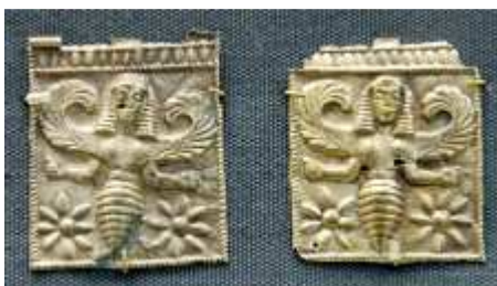
Placas de oro en relieve del siglo 7º antes de nuestra era con las diosas abejas aladas, tal vez la Thriai. Halladas en la ciudad Camiros de Rodas.

Estas tres doncellas que le enseñaron a Apolo a profetizar incluso antes de que Zeus le otorgara la capacidad de conocer la mente divina, generalmente se identifican como las Thriae (o Thria ), el nombre significa guijarros y se cree que hace referencia a las pequeñas piedras que se utilizan en algunos sistemas de adivinación. Más curiosos son sus nombres. Se llaman Melanie ("la Negra"), Kleodora ("Famosa por su don") y Daphnis ("Laurel").