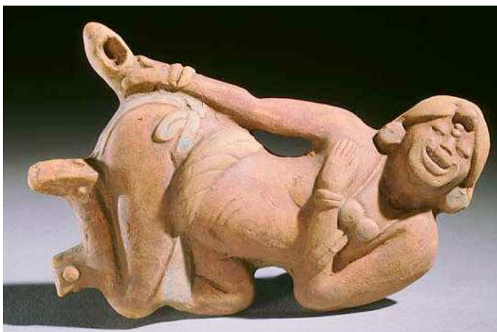
Guatemala Escuintla Maya culture, Escuintla, Middle-Late Classic periods, A.D. 400-850

En el Nuevo Mundo otro sistema para administrar una droga basada en miel, fue usada en particular por los Mayas. Los arqueólogos que excavaron las tumbas Mayas descubrieron tubos (¿de caucho?) cuya función era confusa. Pinturas encontradas en varios jarrones ilustraban detalladamente el uso de estos tubos. Una ilustración muestra una figura recostada con sus piernas extendidas, recibiendo un enema que está siendo administrado por una persona (¿mujer?) parada al lado de él sosteniendo un contenedor conectado a un tubo. Hay otra también, masculina, realizando un enema vertiéndolo de una tinaja grande. Otra pintura de esta clase muestra a una mujer joven atractiva (¿diosa?) quitándole la ropa a un macho (¿dios?). Delante de ella se encuentra un contenedor de enema y lo que parece una jeringa de goma para enema en forma de bulbo. Además de pinturas hay hasta estatuas con el mismo tema.